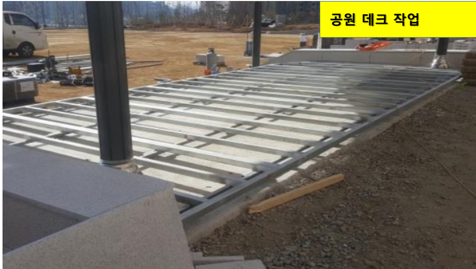
공원 데크 작업