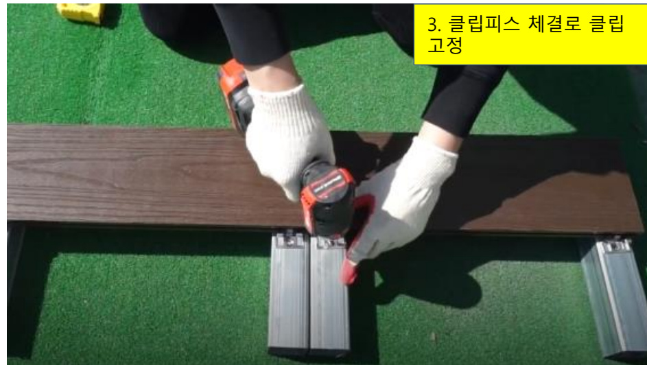
3. 클립피스 체결로 클립 고정