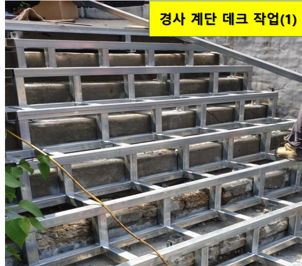
경사 계단 데크 작업(1)