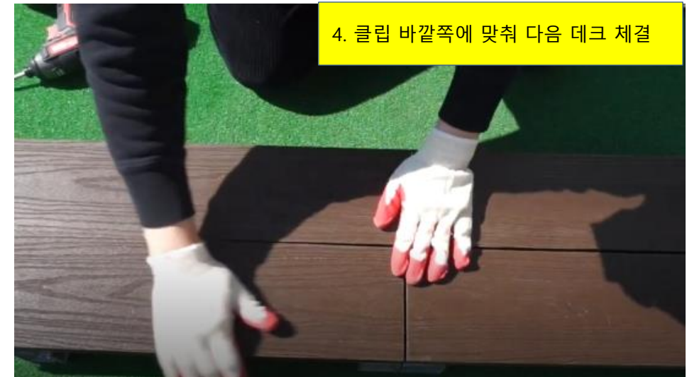
4. 클립 바깥쪽에 맞춰 다음 데크 체결