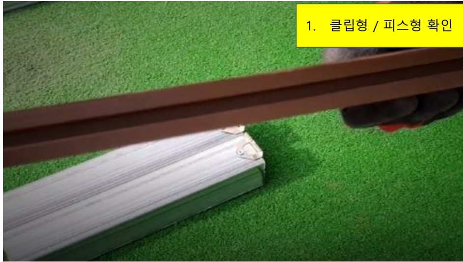
1. 클립형 / 피스형 확인