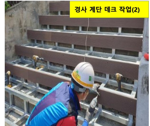
경사 계단 데크 작업(2)