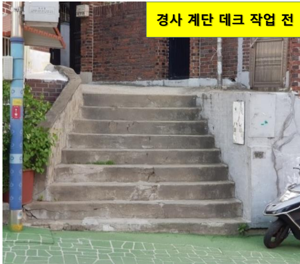
경사 계단 데크 작업 전