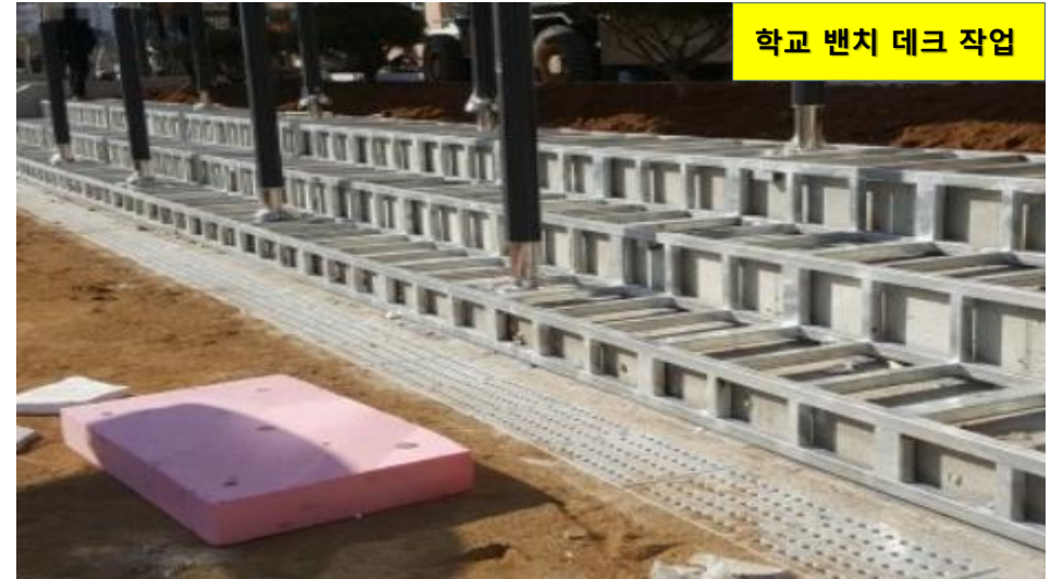
학교 벤치 데크 작업